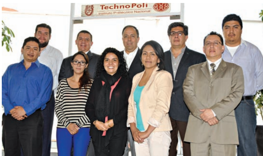
TECHNOPOLI tiene los medios y la infraestructura necesaria para llevar al mercado trabajos académicos que normalmente se encuentran en los cajones y archiveros

Resaltó que muchos proyectos académicos o de investigación logran llegar a ser empresariales y que TECHNOPOLI también es el puente perfecto entre la academia y la industria porque aquí tienen los medios y la infraestructura necesaria para llevar al mercado trabajos académicos que normalmente se encuentran en los cajones y archiveros por no contar con las herramientas necesarias para su implementación.