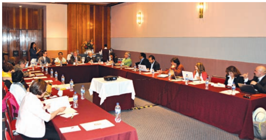
Los especialistas expusieron los avances en sus correspondientes rubros; la recopilación de esta información permitirá guiar nuevas tareas y estrategias de políticas públicas

“La contribución de esta casa de estudios en la conformación del Reporte Mexicano de Cambio Climático es parte de las tareas de difusión institucional, y como todos los participantes, parte de nuestras tareas sustantivas es aportar mediante la ciencia a la solución de los problemas de relevancia para el país”, concluyó.