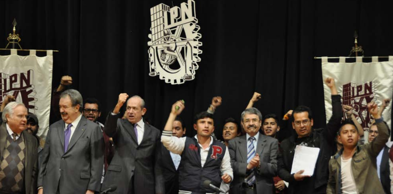
Un ¡huélum! cimbró el auditorio “Ing. Alejo Peralta” tras la firma de los acuerdos y de la Carta Compromiso por parte del Director General del IPN