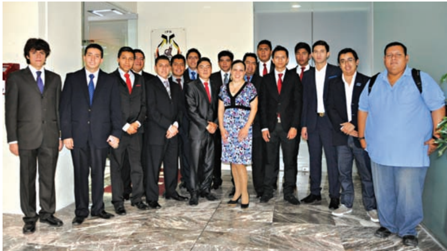
Se presentaron 18 proyectos politécnicos de los niveles medio superior, superior y posgrado

El Instituto Politécnico Nacional (IPN) y la Secretaría de Ciencia, Tecnología e Innovación del Distrito Federal (SECITI) establecieron las bases para generar el Programa Institucional de Apoyo a Emprendimientos Tecnológicos en Etapas Tempranas.