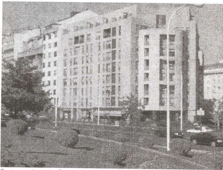
Cuatro caminos, La Coruña, España.

Sin olvidar las propuestas urbanas y arquitectónicas de varios arquitectos, hubo un gran número de programas gubernamentales de reconstrucción con igual tipología de vivienda, diseñados desde Madrid construidos por la especulación, los cuales llenaron villas y ciudades españolas con construcciones de baja calidad. A partir de 1960 se incrementó la industrialización y se produjo un crecimiento económico que posibilitó la formación de una clase media con mayor poder adquisitivo y probabilidad de elección, en un mercado inmobiliario que continuó manejado por la especulación hasta la llegada de la democracia en 1976.