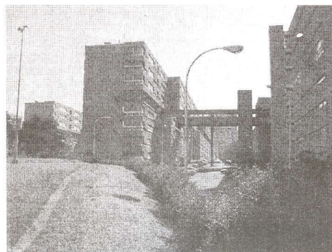
Vivienda social en el barrio Las Flores, La Coruña, España.