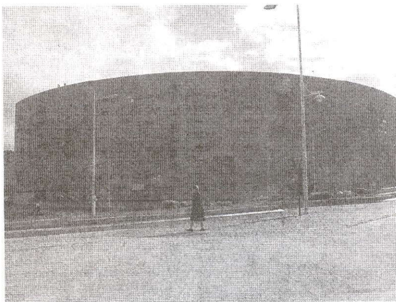
Labañou, La Coruña, España.

En las VPT la subvención únicamente se presta a compradores. Como su nombre indica, es una ayuda a la financiación de compras de vivienda para ventas de bajo precio, prefijados de antemano. Una vivienda nueva o de segunda mano, puede ser considerada como VPT si el área total habitable no supera los 120 metros cuadrados, si no se compra por razones especulativas, y si el precio de la vivienda resultante no excede al fijado por el gobierno.