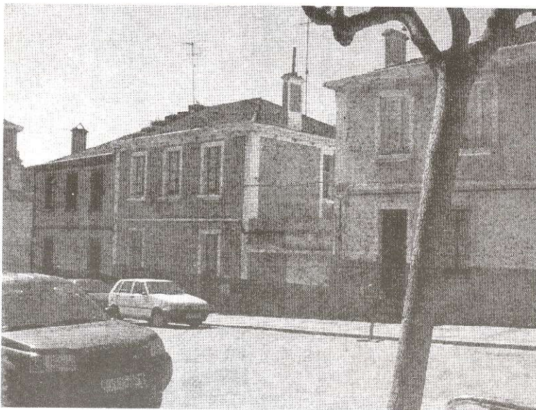
Vivienda social en Monte Alto, La Coruña, España.

Esta situación es ya una realidad en diferentes estados, independientemente de que sean sus gobiernos totalitarios o no, de Japón a Hong Kong o en Estados Unidos, son los mercados inmobiliarios los que definen y controlan desde los precios del suelo hasta la normativa urbanística. Quizá la memoria histórica de estos países haya estado marcada por su menor dedicación a la hora de definir los intereses de su gobierno como protector de sus ciudadanos. Es en Europa donde mayor número de ejemplos se han dado en pos del bienestar de las clases más desfavorecidas, desde los movimientos ilustrados en el siglo XVIII, pasando por las utopías socialistas y las propuestas burguesas de la industrialización del siglo XIX, las teorías del Movimiento Moderno anteriores a la Segunda Guerra Mundial (1939-1945) hasta la reconstrucción de Posguerra. Llegados a la definición de los actuales estados postindustriales europeos, en un sentido genérico salvando sus hechos particulares, comprendo que las actuales políticas sociales, en las que se incluye la de vivienda, son herencia de una historia orientada hacia los hechos sociales.