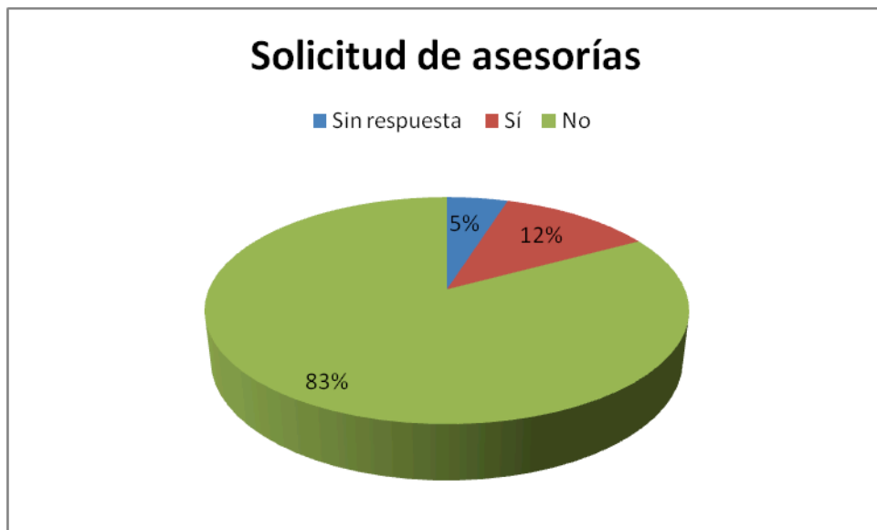
Gráfica 2 Disposición de profesores respecto a las asesorías