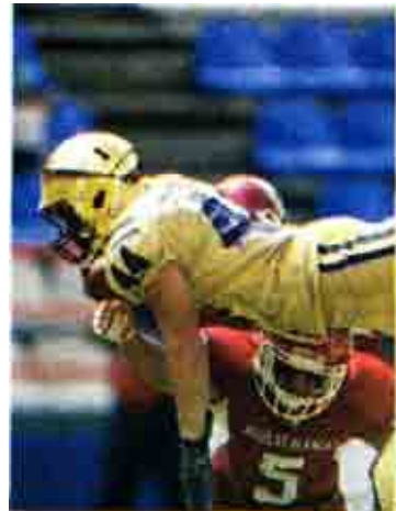
Pumas recibirá a Leones Cancún en playoffs.

UAC a los milagrosos Pumas Acatlán quienes con marca de 3 ganados y 5 perdidos se cuelan a playoffs y con alta posibilidad de dar la sorpresa en esta nueva dinámica que puso la liga estudiantil.