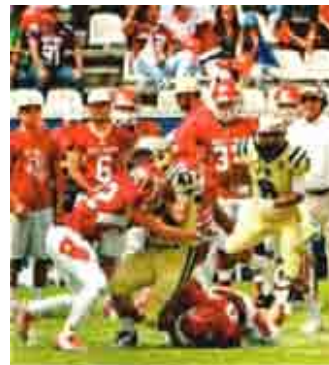
Emoción en el Hidalgo

regular por solo dos descabros y se enfilan a la postemporada contra los Leones Anáhuac de Cancún; Águilas Blancas, por su parte, terminó con foja de dos éxitos y cinco derrotas sin posibilidad de playoffs, pero sí con la esperanza de que el programa camine en el sendero adecuado y la prueba fue la resistencia presentada ayer. LA