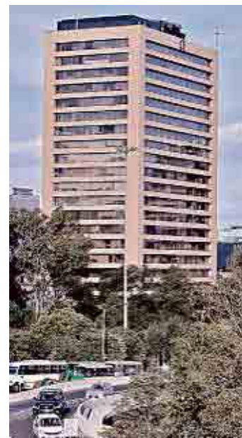
La torre está ubicada en Campos Elíseos, en Polanco.

cina como la oficina del Gobernador. Estaba en la creencia de que esa era la oficina oficial del Gobierno porque allí nos recibe a todos. Yo he sido citado muchas veces allí”.