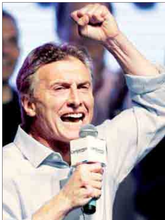
Daniel Scioli, candidato del Frente para la Victoria (izquierda), y el empresario Mauricio Macri, postulado por la alianza Cambiemos, protagonizaron ayer una cerrada lucha electoral en Argentina

■ El oficialista Scioli logró 36.33% de sufragios contra 34.8% del derechista Macri