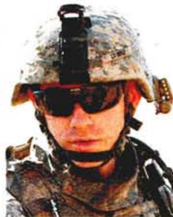
La Sedena usará un modelo similar al de la imagen.