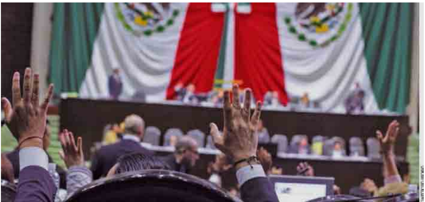
Jalisco. Se espera que los cabilderos intervengan en las negociaciones sobre el Presupuesto de Egresos de la Federación para el ejercicio fiscal 2016.