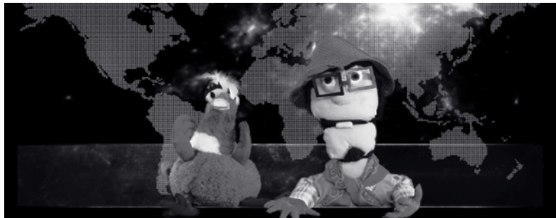
Imagen 1. Imagen del noticiero “Arqueólogos en Apuros”

Dos fueron los objetivos iniciales del noticiero. El primero consistió en generar procesos de auto-reflexión entre los jóvenes respecto a la destrucción de esta ciudad prehispánica y sus valores educativos y culturales. El segundo fue identificar la relación de estos jóvenes con el patrimonio arqueológico desde su perspectiva local.