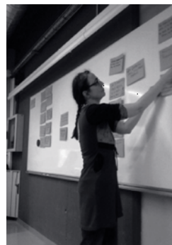
Imagen 3. Técnica de Investigación Participativa.

Esta técnica ha sido desarrollada con éxito en grupos multidisciplinarios como el DhiGeCs de la Universidad de Barcelona, así como en el proyecto Participat del INCIPIT-CSIC en Santiago de Compostela. No obstante, también tenemos reporte de su imple-