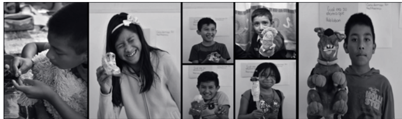
Imagen 5. Noticiero “Arqueólogos en Apuros”. Muestra el resultado del diseño, construcción y caracterización de sus propios títeres de su noticiero

El paso siguiente fue que los niños construyeran sus propios títeres, desde su boceto, fabricación, voz y personalidad. Aquí nosotros explicamos las diferentes modalidades de títeres –botones, de hilo y de calcetín– y las técnicas para fabricarlos, con el objetivo de que, al final del proceso, los niños se apropiaran de su títere y fueran capaces de actuar frente a la cámara.