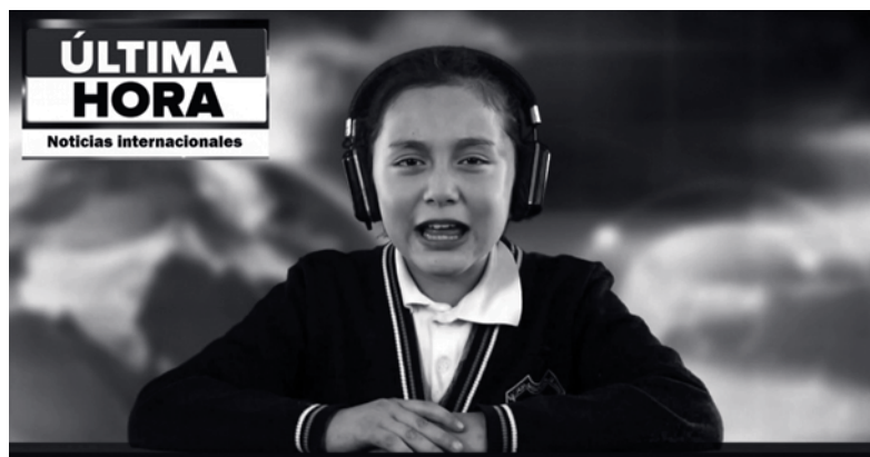
Imagen 4. Proceso de posproducción del noticiero.

Una vez realizado esto y empleando el mismo sistema de tarjetas (IP), definimos los tópicos del guion, llegando al acuerdo de que el noticiero recrearía de forma ficticia el hallazgo del esqueleto de un perro y su dueño, es decir de un antiguo teotihuacano ya que en el pensamiento indígena mesoamericano se creía que el perro ayudaba a su amo a cruzar un río en el noveno nivel del inframundo.