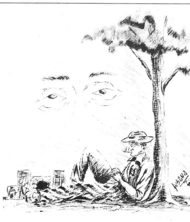
Ilustración: Susana Cardoso Tinoco.

Música, color, expresión y vitalidad; Javier eres todo esto y más. Estés donde estés, nunca te olvidaremos.