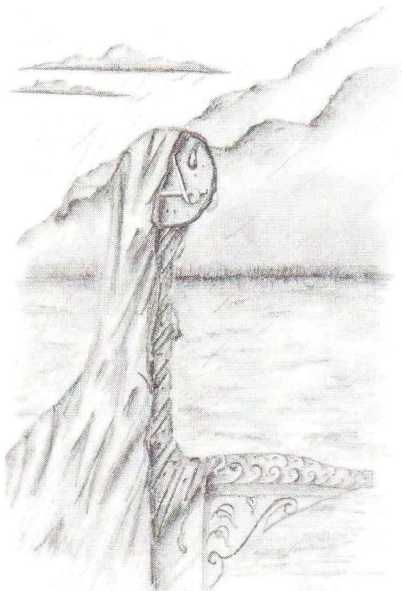
Ilustración: David Vela Correa.