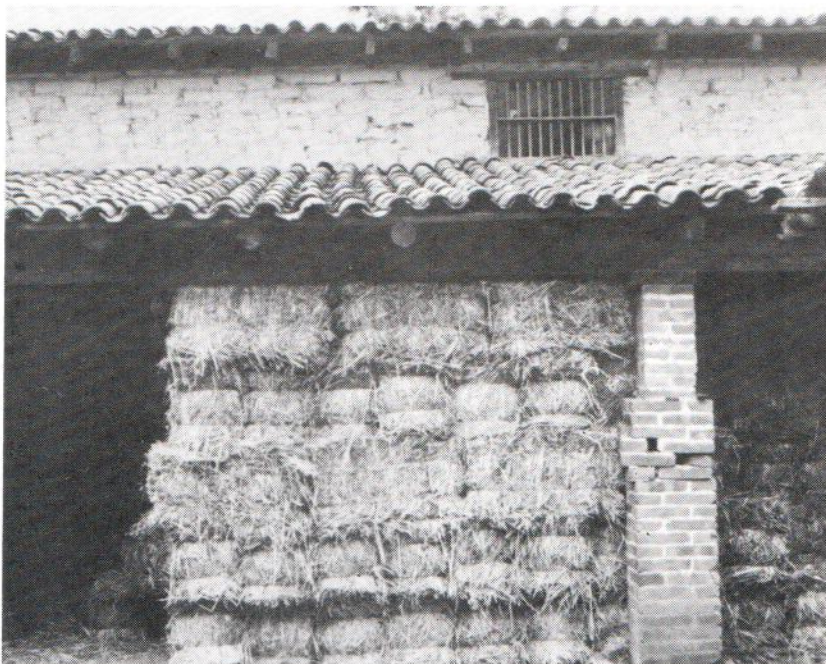
Algunas casas se utilizan como bodegas.

Las fachadas principales presentan tres elementos básicos: pretil, corredor y columnatas. Al describir las fachadas antiguas los pobladores otorgan suma importancia al corredor: "el corredor es un lujo para la casa, para poner macetas, para atajarse del agua. El corredor es como un adorno, como una fachada de la casa, es el estilo del hogar. Todas las casas antiguas tenían