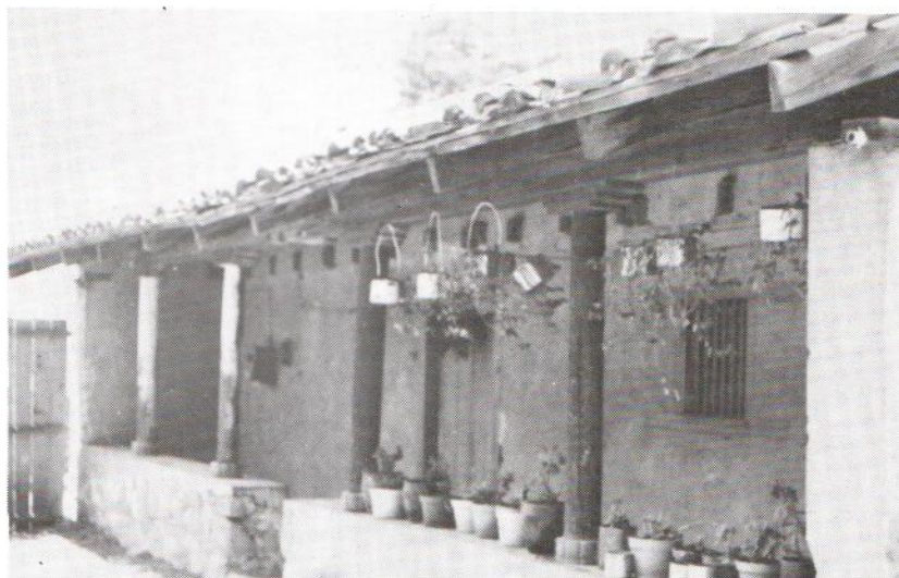
Vista de un corredor típico en Xalatlaco.

La influencia prehispánica se observa en la utilización del tlecuil y el comal. Son también tradicionales las hornillas en meseta. Además de estos