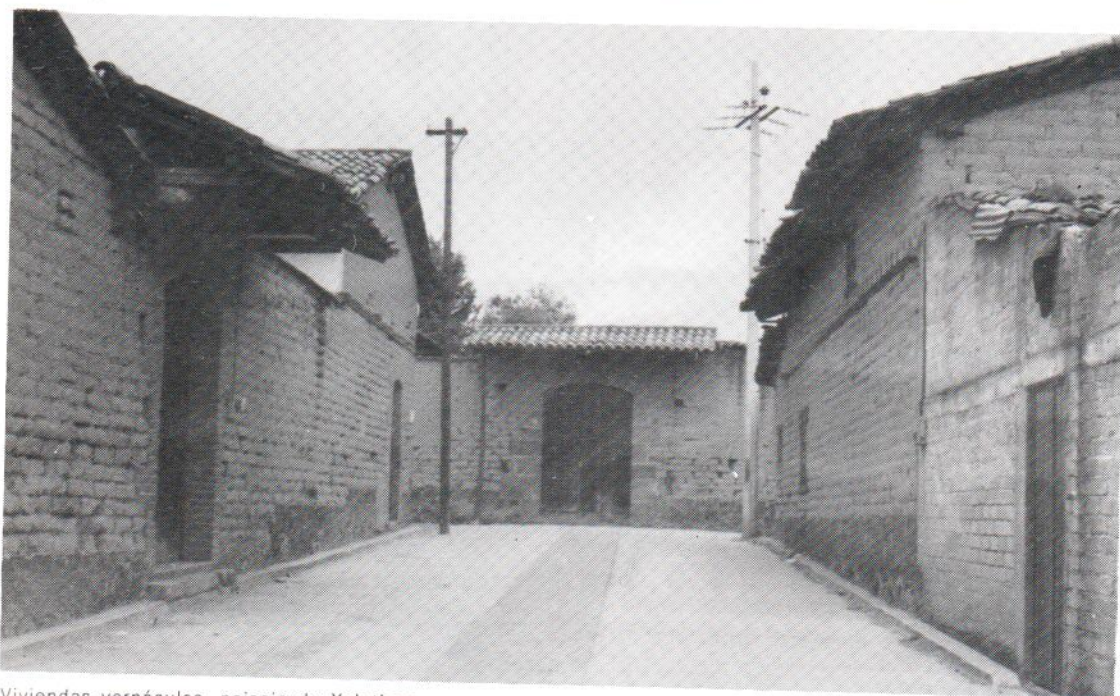
Viviendas vernáculas, paisaje de Xalatlaco.

corredor, era como darle realce a la casa, era parte de una buena presentación, algunas tenían ventanitas con marco y puro barrotito, así era el estilo de la casa". 4