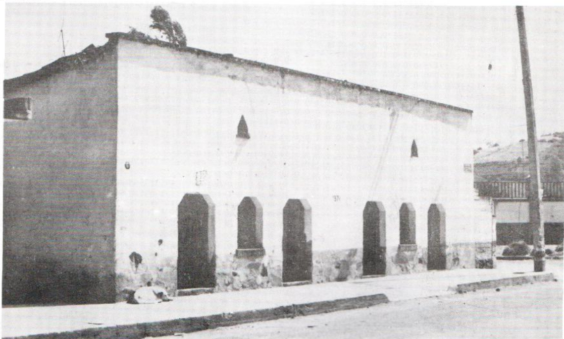
Ejemplo de arcos ochavados.

En términos generales, todas las personas dan un significado de gran importancia a lo que la casa vernácula representa. Afirman que la relación entre las edificaciones de adobe y teja junto con el resto de tradiciones, son la estructura de la historia del pueblo, le dan identidad. Desgraciadamente esto se está perdiendo.