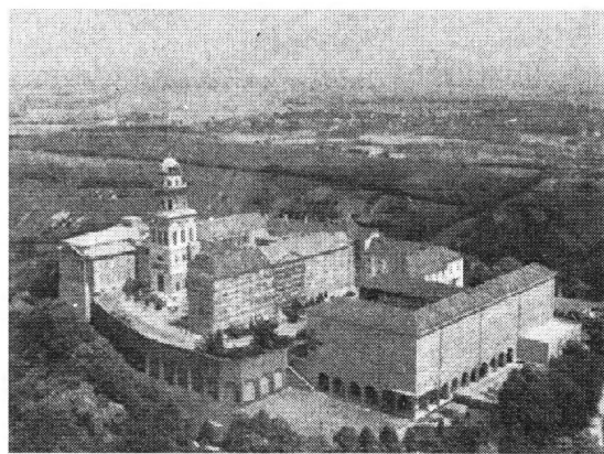
Plaza de la República.