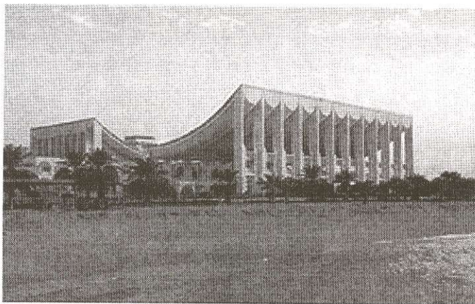
Asamblea Nacional de Kuwait.

mia de Bellas Artes de la capital danesa, donde estudió con Kay Fischer y Steen Eiler Rasmussen.