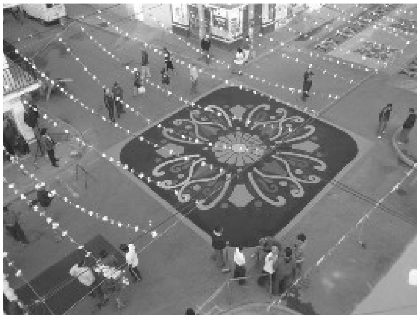
El tapete con el diseño de un mosaico de talavera ya terminado es admirado por los vecinos, será arrasado por la procesión de la Santa Patrona.

conquista española, por lo que se organizan entre ellos para realizar las festividades en honor al santo patrono de su devoción: Santa Clara.