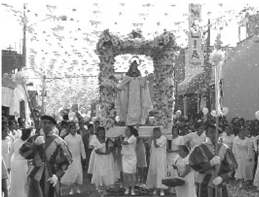
La procesión es representada con la pureza de la niñez, la fiesta de la gente y la solemnidad de los guardias.

Existen diversos hechos que reflejan la devoción a su patrona. La fiesta principal de Santa Cla-