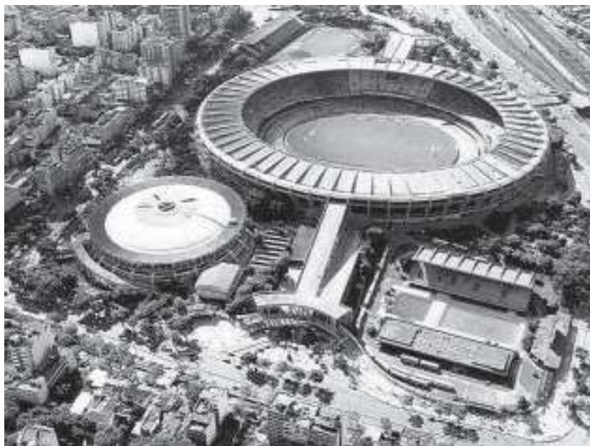
Foto1: Estadio Maracanã en Río de Janeiro.

5 En 1964 se le dio su nombre actual, Journalista Mário Filho , en honor al periodista fundador del Journal dos Sports , un diario local, pero para los habitantes de Brasil su nombre fue y, seguramente, seguirá siendo Maracanã. De Wikipedia, la enciclopedia libre. Estadio Maracanã . www.es.wikipedia.org