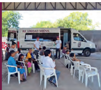
BRIGADAS EMERGENTES #POLITÉCNICOSSOLIDARIOS