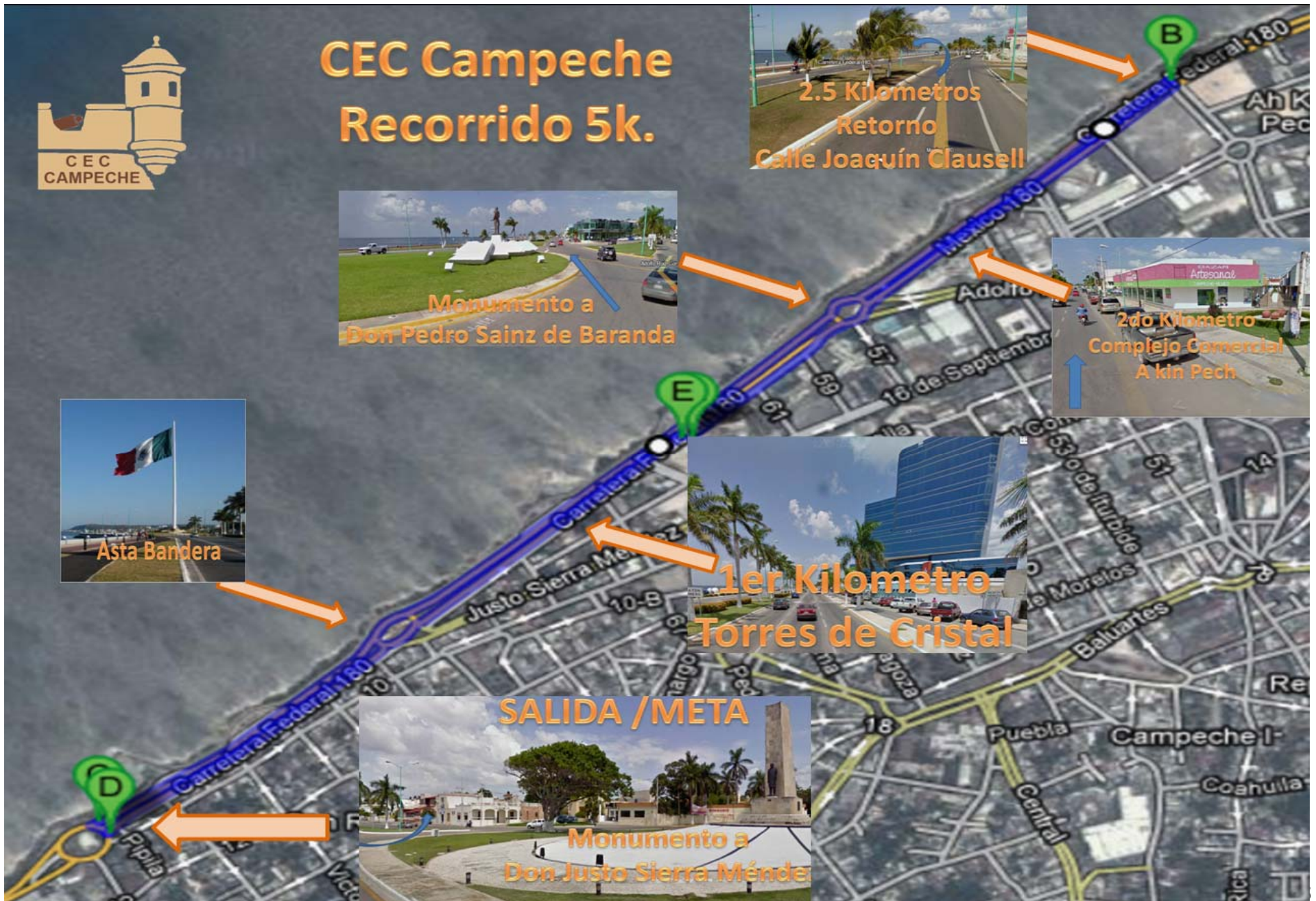
Imagen de ruta