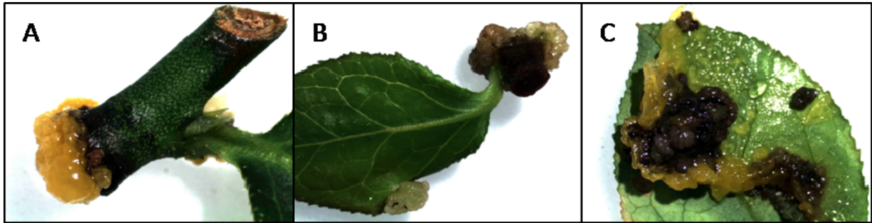
Figura 4. Regeneración de callo organogénico a partir de secciones de tallo con una yema axilar de arándano Vaccinium corymbosum L. A). Callo en la base del explante; B) y C) Callo organogénico en la superficie adaxial y abaxial de la hoja, en contacto con el medio de cultivo.

Cao et al. (2003) obtuvieron resultados similares al aplicar 10 \text{ g L}^{-1} de sacarosa en explantes de arándano; estos autores concluyeron que con esta cantidad se promueve la proliferación de yemas axilares sin interferir en el transporte de genes; otros autores mencionan que los niveles de sacarosa adecuados para el cultivo in vitro del arándano están por debajo de los 15 \text{ g L}^{-1} (Rowland and Ogden, 1992; Cao et al. , 1998, 2002; Cao and Hammerschlag, 2000). Por su parte Debnath (2004) concluye que la concentración óptima de carbohidratos para cultivo in vitro de arándano se encuentra entre 10 y 20 \text{ g L}^{-1} , datos similares a los de la presente investigación. Menciona además, que la concentración más baja de sacarosa puede estimular la proliferación de yemas axilares en arándano lowbush.