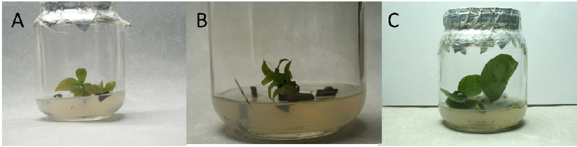
Figura 2. Regeneración in vitro de arándano. A) yema axilar en brotación. B) explante con necrosis. C) explante contaminado.

Nuestros resultados obtenidos muestran que no se requieren grandes cantidades de hipoclorito de sodio (30 % v/v) para desinfectar los explantes de arándano, similar a lo informado por Debnath et al (2008) quien obtuvo 75 a 85 % de explantes asépticos de arándano lowbush ( Vaccinium angustifolium Ait) cuando utilizó hipoclorito de sodio 0.79 % (15 % cloro comercial) y sólo cuantificó de 5 a 10 % de explantes contaminados. Por el contrario Meiners et al. (2007) quienes utilizaron concentraciones 3 % de i.a. de este compuesto durante 10 minutos en arándano variedad “Ozarkblue”. Kaldmä et al (2006) mencionan que con 3 % de hipoclorito de sodio (50 % v/v) obtuvieron 98 % de sobrevivencia en explantes de Vaccinium angustifolium colectados en el mes de mayo, aunque estos autores mencionan que la contaminación depende de la época de colecta, debido a que los explantes colectados en febrero presentaron 42 % de explantes libres de agentes fitopatógenos.