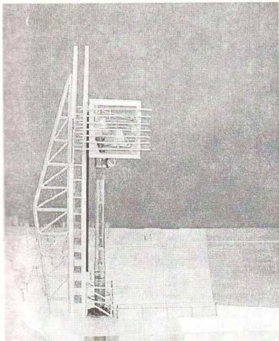
El proyecto ganador.