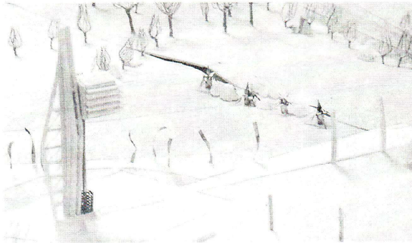
Maqueta del proyecto seleccionado.