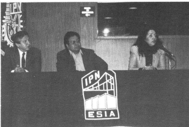
Alumnos y profesores compartieron sus trabajos de investigación.