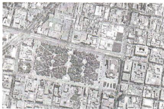
Foto aérea del contexto urbano.