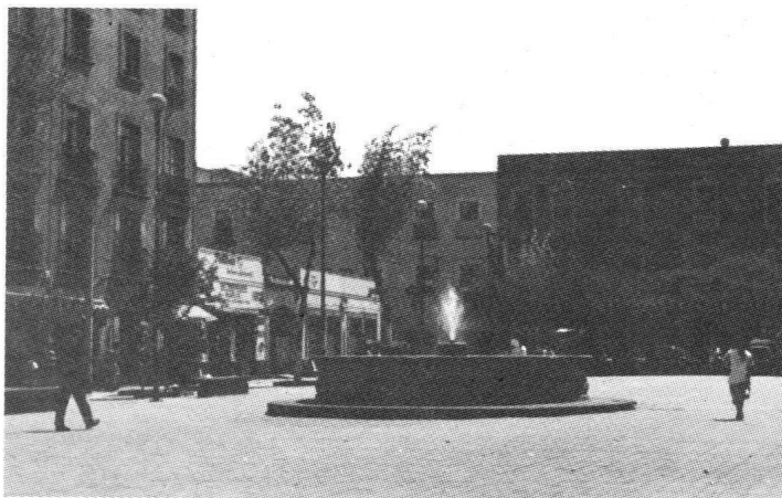
Plaza Juan José Baz o "La Aguilita".