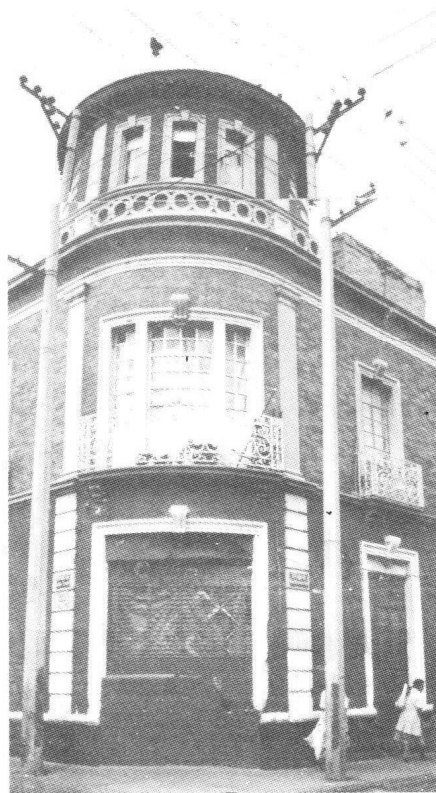
Casa habitación. Santo Tomás núm. 69, esquina Misioneros.

En este marco de cooperación interinstitucional, desde el inicio de la investigación se acopló la perspectiva del Fideicomiso –que solicitaba un diagnóstico-propuesta para un polígono importante,