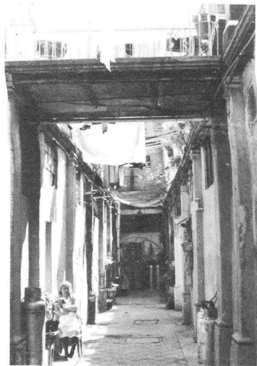
Vecindad ubicada en Manzanerales núm. 21.

Como resultado del diagnóstico, se llegó a una serie de propuestas de intervención urbana y arquitectónica, buscando retener a la población, mejorar sustancialmente la calidad de vida, proporcionar mejores servicios —a nivel barrial y otros de interés para el Centro Histórico y la capital—, buscando la combinación de acciones con diferentes elementos espaciales y constructivos, de acuerdo a las características del barrio, los requerimientos de los habitantes y usuarios de cada zona, ponderando el fortalecimiento de la identidad por medio de la activación de los dispositivos de integración en que se sustenta la convivencia y la valoración del patrimonio comunitario, con lo que se aspira a lograr la integralidad de los proyectos; entre estas propuestas destacan: la rehabilitación del entorno habitacional de la Plaza de La Aguilita (centro del barrio), el mejoramiento de vivienda, la recuperación del ex convento de La Merced, el mejoramiento de las zonas de San Pablo y Jesús María para su incorporación al uso habitacional y turístico, la unidad sociocultural y la reintegración territorial del barrio —actualmente cortado por Anillo de Circunvalación—, el aprovechamiento de plazas y jardines para la recreación y descanso de habitantes y visitantes, entre otras.