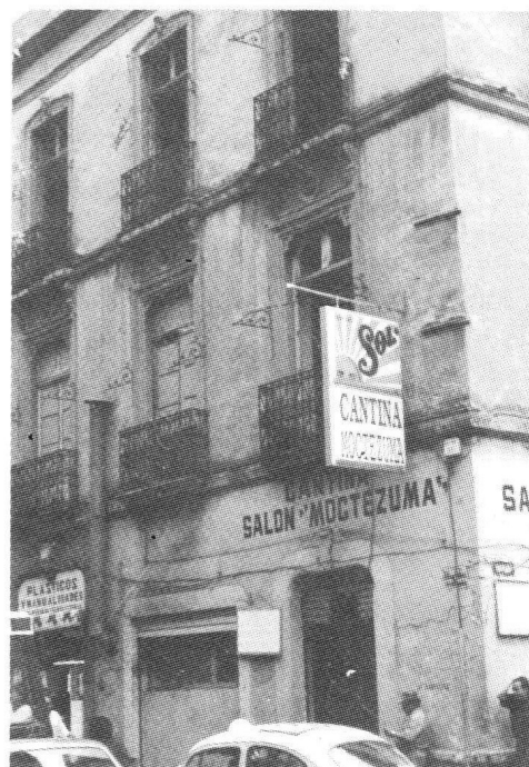
Cantina y casa habitación semiocupada en Jesús María núm. 16.